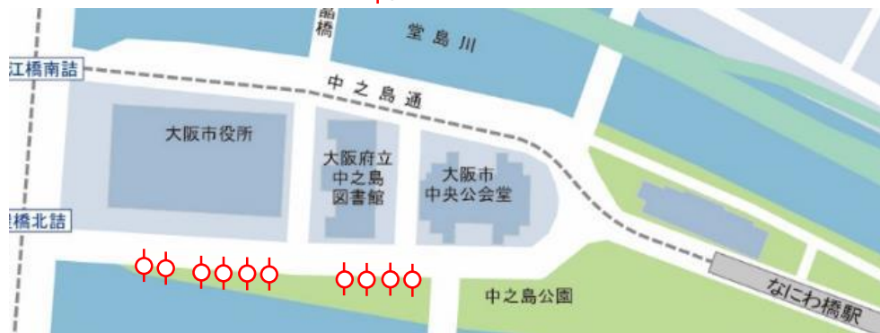
みおつくしプロムナード