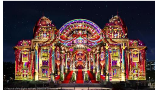
OSAKA光のルネサンス2018 “ウォールタペストリー”イメージパース

100周年を迎える大阪市中心公会堂とコラボした光のアート作品をはじめとしたメインプログラムをご紹介します。