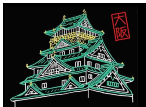
大阪城西の丸庭園から出張展示！

開催期間：2024年12月14日（土曜日）から12月25日（水曜日）まで 開催時間：17時から22時まで 開催場所：みおつくしプロムナード南側（女神像前）