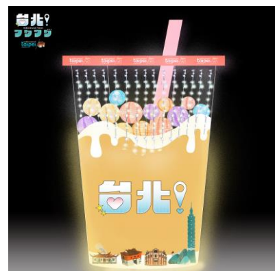
カラフルにタピろう！

開催期間：2024年12月14日（土曜日）から12月25日（水曜日）まで 開催時間：17時から22時まで 開催場所：みおつくしプロムナード南側（女神像前）