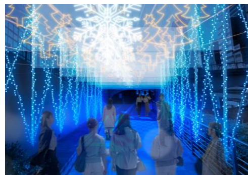
バラ園へと続く光のトンネル

開催期間：2024年12月14日（土曜日）から12月25日（水曜日）まで 開催時間：17時から22時まで 開催場所：中之島公園 水上劇場川沿い